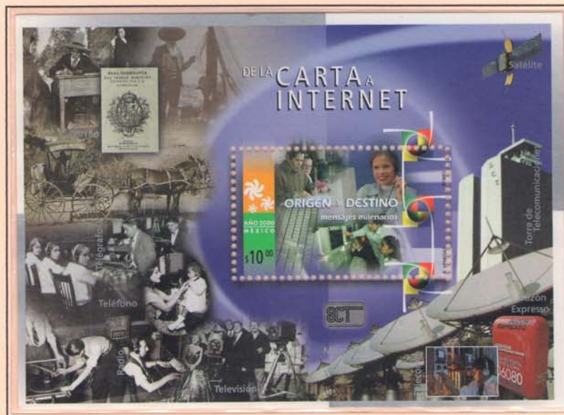
OPERATRICE DAVANTI AL SUO COMPUTER E DONNA CON DUE BAMBINE CHE GUARDANO UNO SCHERMO