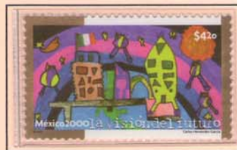
DISEGNO DI CARLO HERNANDEZ GARCIA