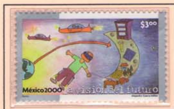
DISEGNO DI ALEJANDRO GUERRA MILLAN