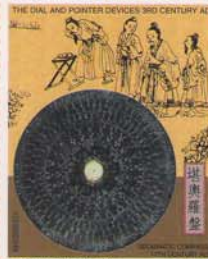
FEDERATED STATE OF MICRONESIA 33¢