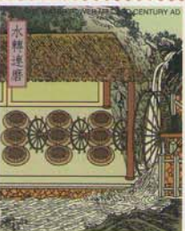
FEDERATED STATE OF MICRONESIA 33¢