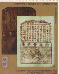
FEDERATED STATE OF MICRONESIA 33¢