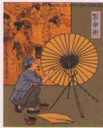
FEDERATED STATE OF MICRONESIA 33¢