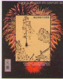
FEDERATED STATE OF MICRONESIA 33¢