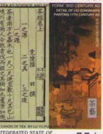
FEDERATED STATE OF MICRONESIA 33¢