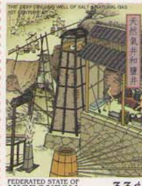
FEDERATED STATE OF MICRONESIA 33¢