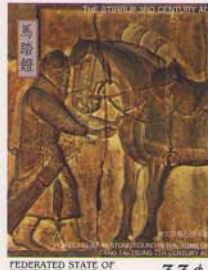
FEDERATED STATE OF MICRONESIA 33¢