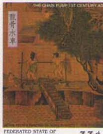
FEDERATED STATE OF MICRONESIA 33¢