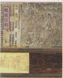
FEDERATED STATE OF MICRONESIA 33¢