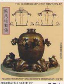
FEDERATED STATE OF MICRONESIA 33¢