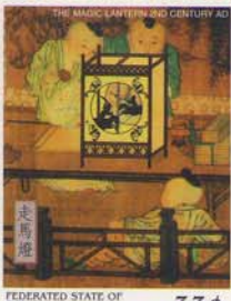
FEDERATED STATE OF MICRONESIA 33¢