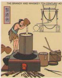
FEDERATED STATE OF MICRONESIA 33¢